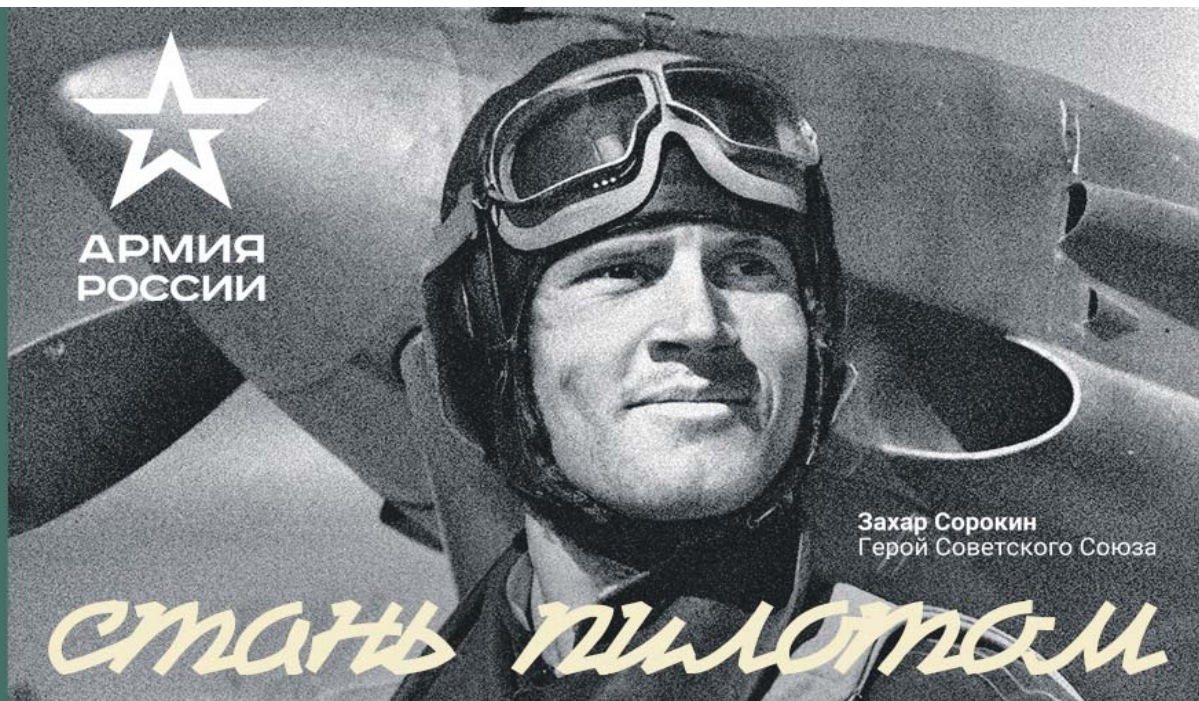
Захар Сорокин Герой Советского Союза