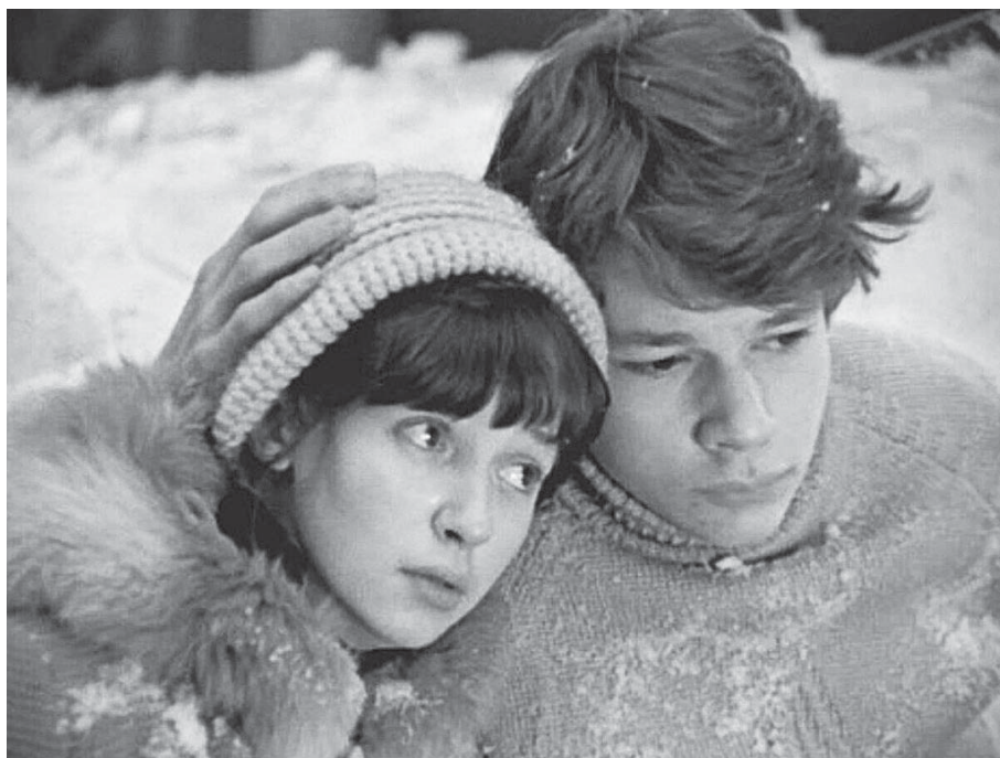
Кадр из к/фильма «Вам и не снилось»

Ушел из жизни великий режиссер Илья Абрамович Фрész 22 июня 1994 года в Москве. ■