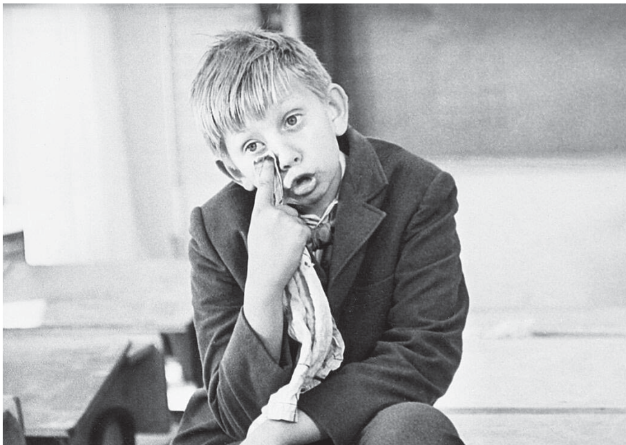
Кадр из к/фильма «Чудак из пятого «Б»

Столь тщательная, кропотливая работа над каждым своим творением позволяла художнику снимать фильмы, каждый раз стано-