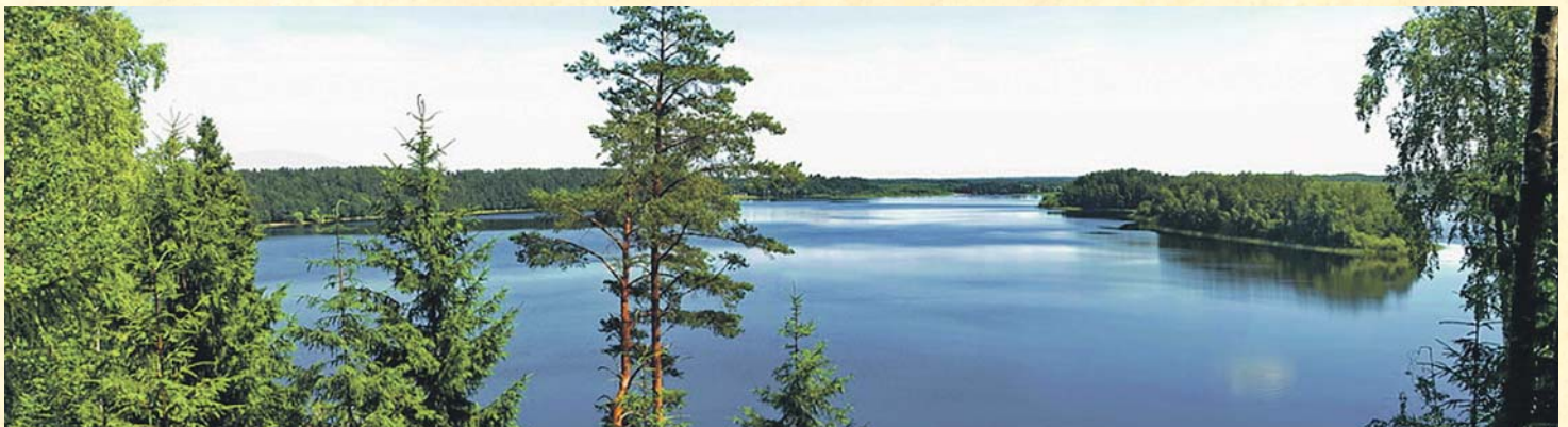
Парк "Смоленское Поозерье"