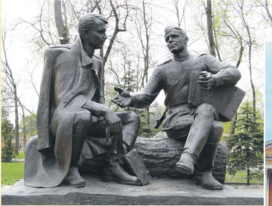
Памятник Твардовскому и Теркину