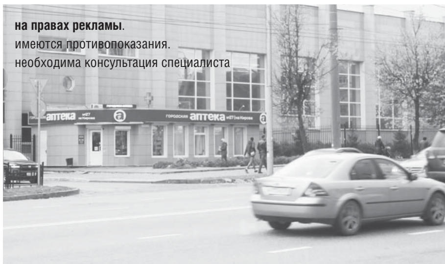
на правах рекламы. имеются противопоказания. необходима консультация специалиста

— Мы работаем над тем, чтобы в каждом муниципальном образовании Смоленской области была бы наша аптека. Город Смоленск в целом ими насыщен (хотя в некоторых местах еще есть необходимость). А вот в районах для нас пока большое поле для развития. «Городская аптека» предлагает жителям райцентров отличные невысокие цены. К сожалению, в том же Сафонове, Дорогобуже и ряде других райцентров цены в местных аптеках просто заоблачные. Почему? Да потому что там нет конкуренции. Точнее сказать, не было. Пока не появилась «Городская аптека». ■