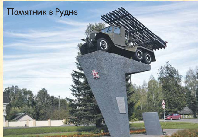
Памятник в Рудне