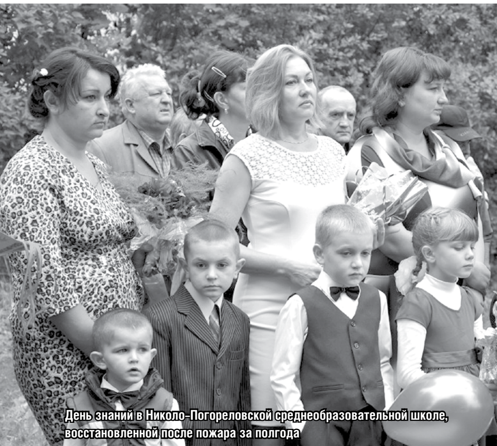
День знаний в Николо-Погореловской среднеобразовательной школе, восстановленной после пожара за полгода